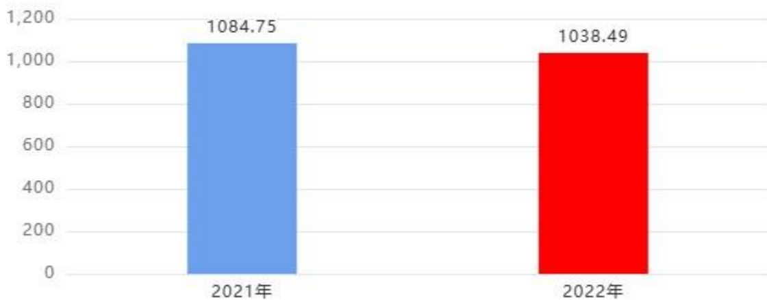
收入、支出决算总计对比图（单位：万元）

2022 年度收入总计、支出总计均为 1,038.49 万元，与上年相比收入总计、支出总计均减少 46.26 万元，下降 4.26%，下降的主要原因是：主要原因减少普惠金融发展支出，其他科目也存在略微差异。