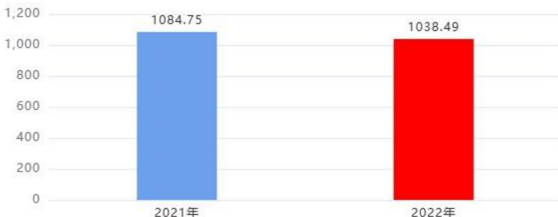
财政拨款支出对比图（单位：万元）