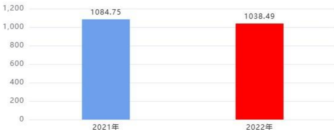
财政拨款收入、支出总计对比图（单位：万元）