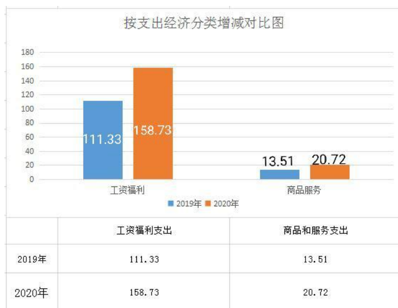
（支出经济分类增减对比图）

其中：机关工资福利支出 158.73 万元，较上年增加 47.4 万元，原因是单位人员增加，工资福利支出增加。